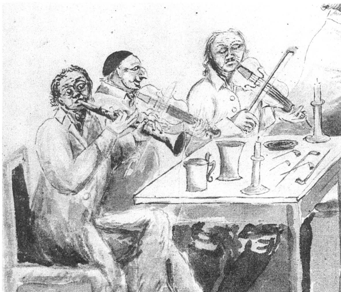
Spelmän i början av 1800-talet, teckning av C. P. Sack. Enl. Sten Lundwall i Fatabu- ren, 1947.

båda delarna”. Fagerberg var dessutom fattig och behövde inte betala för undervisningen. I stället fick Stenberg litet mjöl som han kunde koka gröt av på kvällarna tills han i juni reste tillbaka till Haistila för att fortsätta som informator hos samma herrskap som tidigare.