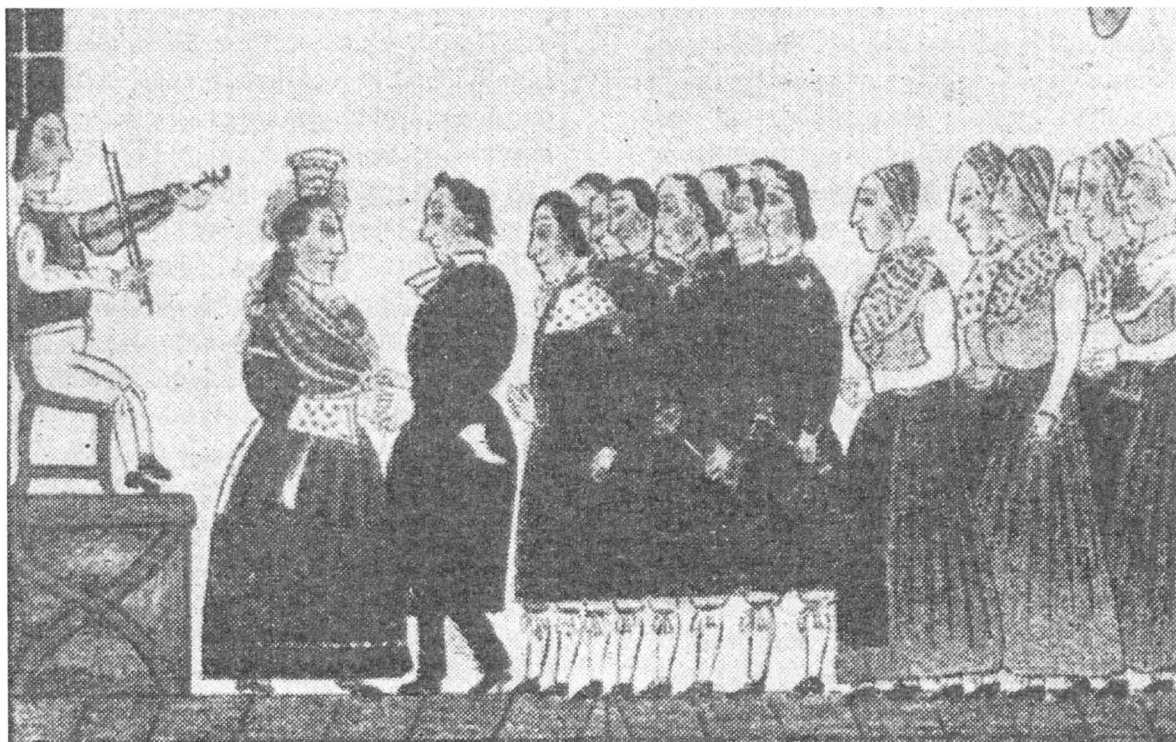
Prästen dansar med bruden. Enl. K. Robert V. Wikman i Det glada Sverige, 1947.

Också hans kusin lovade att lära honom gratis om han skaffade sig en viol. Det hade han inte råd med, och han fick inte heller låna någon, därtill saknade han intresse, så saken förföll.