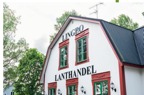
Lingbo Lanthandel

Lingbo Hembygdsgård ligger cirka 300 meter från Lingbo Kyrka och Församlingshemmet i Lingbo. Lingbo Lanthandel ligger 25 meter från hembygdsgården. Silverbockens Camping ligger cirka en kilometer från hembygdsgården.