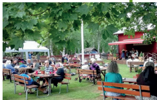
Lingbo Hembygdsgård