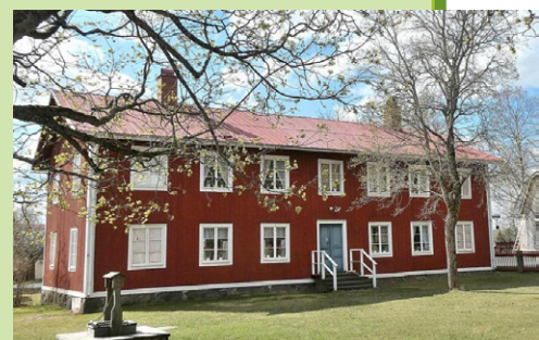
Lingbo Hembygdsgård

Vi upprättar spellista på plats. Spelpass 20-30 minuter.