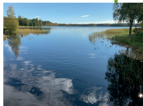
Sjön Lingan